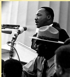
Martin Luther King 28 août 1963